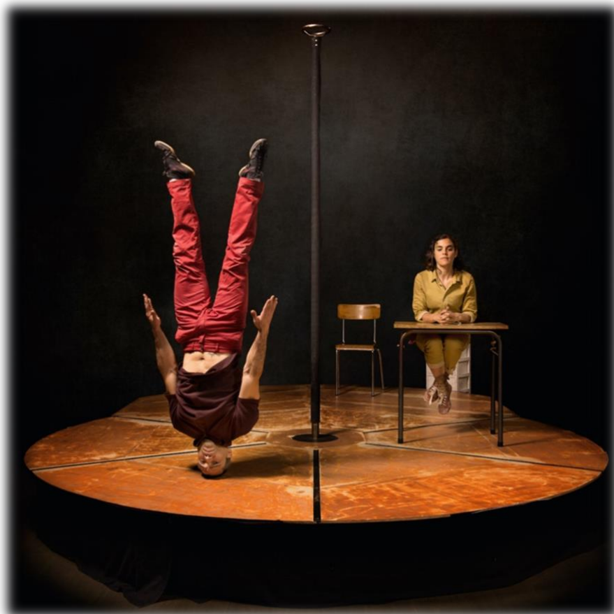
Corps de Bois