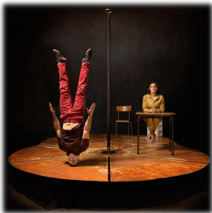
Corps de Bois